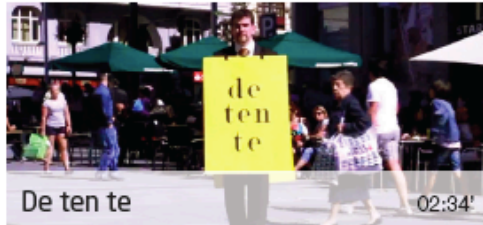
De ten te